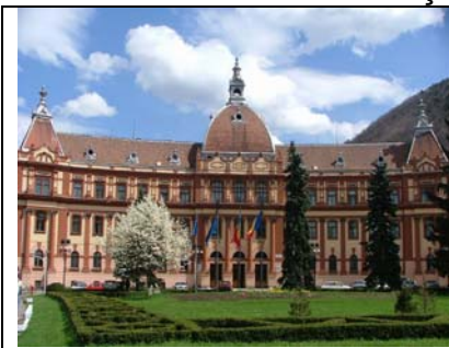
Prefectura Brașov în anul 2007

Am ajuns în zona Primăriei (Comitetul Municipal). Aici am văzut că, dintr-un camion, au coborât milițieni (elevi-soldați de la miliție), cu scuturi din placaj -despre asta nu scrie multă lume care nu are habar, nefiind acolo!. Au încercat să lovească în mulțime, dar mai mult au fost ei loviți de dalele smulse din caldarâm, deoarece nu vedeau nimic prin placaje și primeau lovituri fără să-și dea seama de unde vin. Nu erau pregătiți pentru astfel de confruntări, care nu avuseseră loc în România și nu se dotaseră cu scuturi transparente.