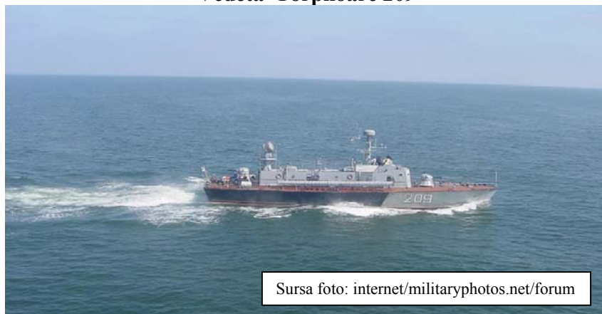
Vedeta Torpiloare 209