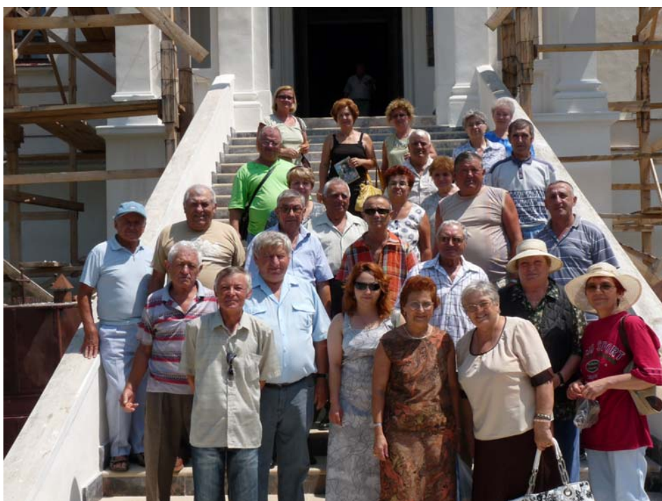
O poză de grup făcută pe treptele bisericii din incinta unei mănăstiri