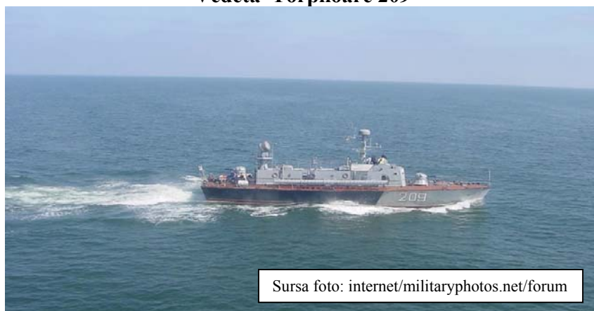
Vedeta Torpiloare 209