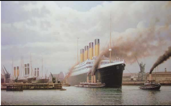
TITANIC – Pictura de Rodney Charman

Transatlanticul „Titanic”, care s-a scufundat în 1912, face și acum... valuri. De această dată, la casa engleză de licitații Aldridge&Son din comitatul Wiltshire .