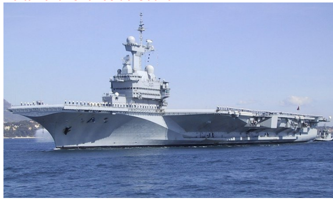
Portavionul Charles de Gaulle