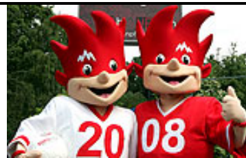
Trix și Flix sunt Mascotele Campionatului European de Fotbal 2008

Încrezuți nevoie mare, că de ... au bătut la scor și Franța și Italia iar pe români i-au umilit cu rezervele, olandezii au clacat în meciul cu Rusia. Rușii i-au învins cu armele lor, atacându-i continuu, și nu ar fi de mirare ca acești tineri fotbaliști fără „fițe” conduși de un bun antrenor olandez să ajungă în finala Campionatului European. Olanda -Rusia 1-3 (după prelungiri).